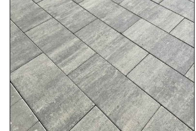
Рисунок мощения площадки

Тротуарная плитка крупноформатная, Прямоугольник 6.5.П.В 600x300x80мм Цвет: Листпад гладкий Антрацит